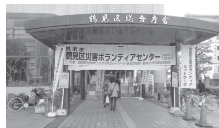
区役所1階 (=災ボラセンター) 入口