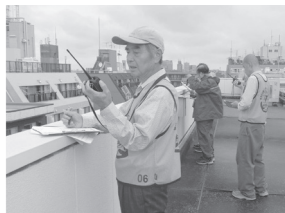
災ボラセンター＝ 区社協屋上の様子